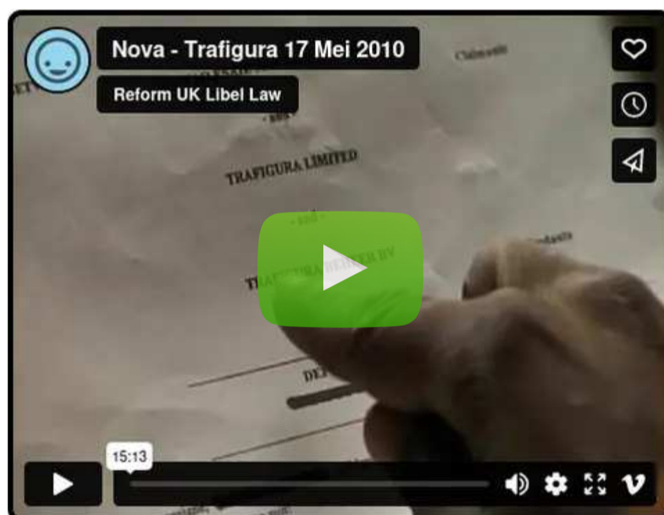
Vimeo | Trafigura šoferi: „Mūs uzpirka“

“ Vimeo komentētājs: „Paldies, lai arī tu esi, ka to pieejamu dari. Kā tev zināms, šeit Lielbritānijā mums nav atļauts ne lasīt, ne redzēt neko no šī.“